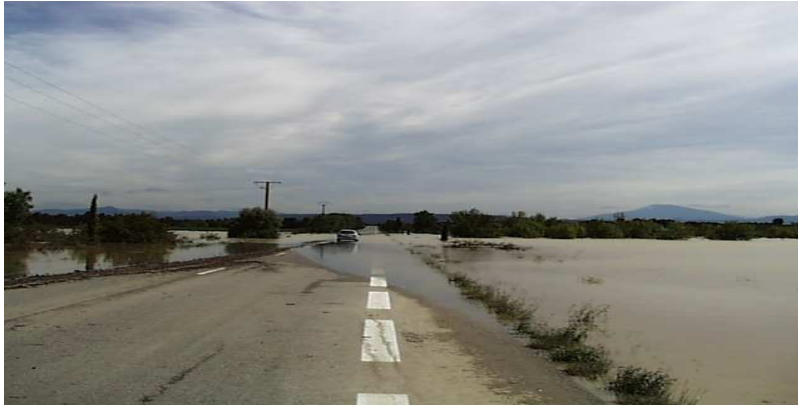
Inondation d'une route près de Rohegude

Le débordement indirect d'un cours d'eau peut se produire: par remontée de l'eau dans les réseaux d'assainissement ou eaux pluviales ; par remontée de nappes alluviales ; par la rupture d'un système d'endiguement ou autres ouvrages de protection.