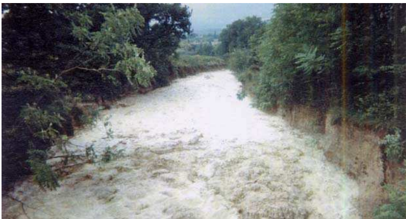
Le Grand Vallat (1993). Commune de Valréas

Ce type de phénomène se retrouve par ailleurs dans les vallats (ou talwegs).