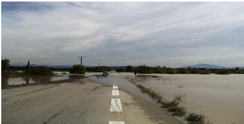
Inondation d'une route près de Rohegude

Le débordement indirect d'un cours d'eau peut se produire: par remontée de l'eau dans les réseaux d'assainissement ou eaux pluviales ; par remontée de nappes alluviales ; par la rupture d'un système d'endiguement ou autres ouvrages de protection.